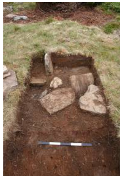
Plantegning av hustuft 1 og bilde av ildstedet i tufta under utgravning. Foto & tegning: KHM.