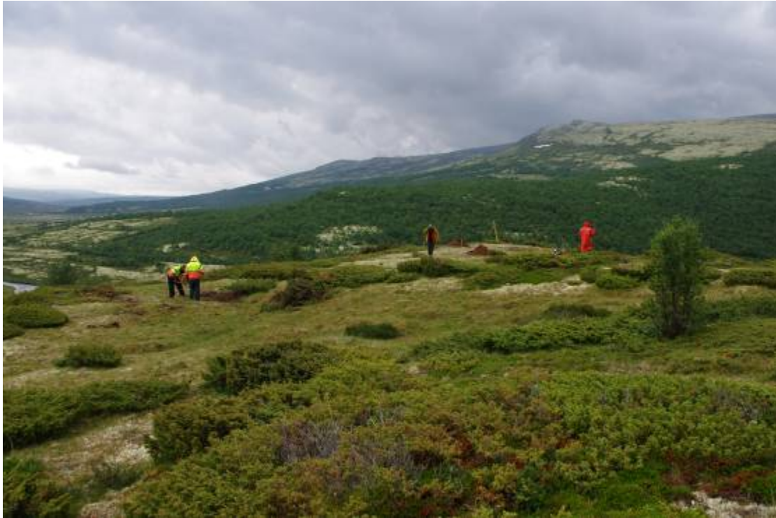
Stulen. På toppen av høgdedraget ligger det tre hustuffer.

Stulen er et område hvor det er registrert fem hustuffer. De to vestligste fangstgroperne i det store fangstgroppsystemet ligger like ved tuftene. På grunn av navnet er det antatt at det har vært en seter her. I følge lokal tradisjon skal Stulen/setra være flyttet til dagens Bjørnsgardseter. Tre av hustuftene (hustuft 1, 3 og 4) og to fangstgroper ble undersøkt.