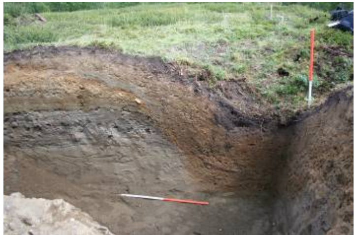
Fangstgrop 4 før og etter utgravning.

Den østligste undersøkte fangstgropa (fangstgrop 6) i det store fangstgropssystemet var gravd ned i skifrig fjell, og har derfor bevart den opprinnelige kasseformen. En lang steinhelle som har ligget på toppen av vollen for å hindre reinen i å komme opp var sklidd ned i gropa.