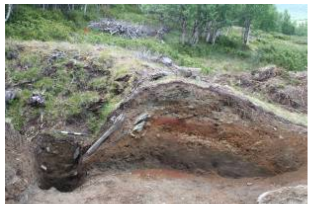
Fangstgrop 6 før og etter utgravning.