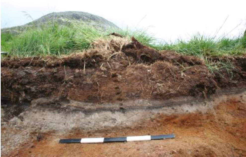
Det eldre åkerlaget ses som en mørk stripe (et ca. 5 cm tykt lag med kullbiter) mellom lag med lys sand (utvaskningslag).

Pollenanalysen av en myrsøyle tatt ved Haverdalssetra i 2009 viser at det har foregått korndyrkning over en lengre periode, trolig fra 600-tallet. Det er påvist korn av bygg og havre. I en grøft inne på setervollen framkom en profil med et eldre åkerlag.