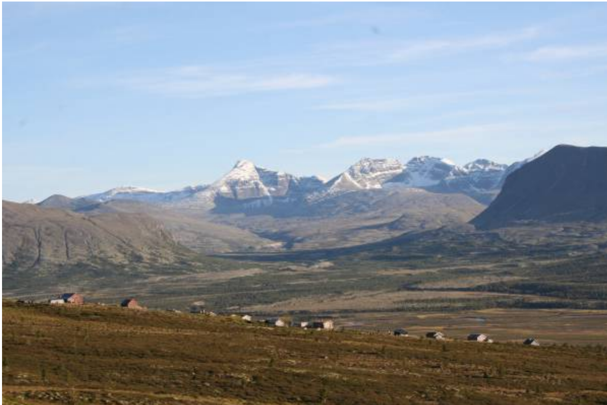
Tollefsshaugen med Rondane i bakgrunnen.

Kulturhistorisk museum gjennomførte arkeologiske undersøkelser i området rundt Grimsdalshytta/Bjørngardsetra og ved Haverdalssetra i juli 2010. Fem fangstgroper for rein, fire hustufter og fossile åkerspor ble undersøkt ved Grimsdalshytta, og en fangstgrop og fossile åkerspor ble undersøkt i Haverdalen.